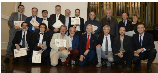
Le "chitarre d'oro" assegnate al Convegno 2016

– All semifinalists and finalists will receive an Honorary Diploma.