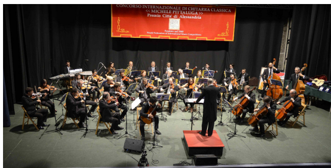
Finale con orchestra 2016