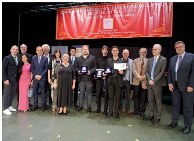
Premiati, Giuria ed Autorità al 56° Concorso Pittaluga

e-mail: concorso@pittaluga.org - www.pittaluga.org