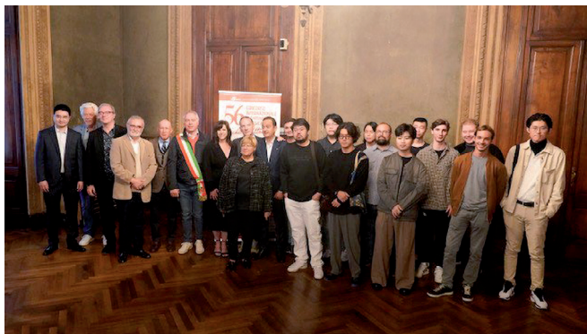
Candidates and Jury 2024-Alessandria City Hall

Comitato Promotore del Concorso di Chitarra Classica «Michele Pittaluga» Piazza Garibaldi 16 - 15121 Alessandria (Italia) Fax 0039-0131-25.31.70 Tel. 0039-0131-25.31.70 — 0039-0131-25.12.07 e-mail: concorso@pittaluga.org - www.pittaluga.org